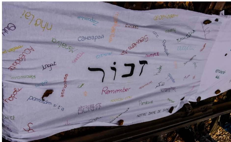
Drap Souviens toi déposé sur les rails de Birkenau le 20 novembre 2018

Raphaëlle Zelkowicz : Responsable éditoriale