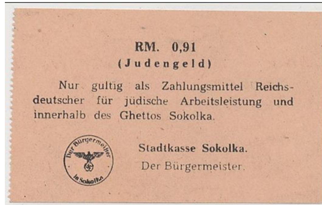
Document présenté sur le site World and Military Notes (worldandmilitarynotes.com)

En Pologne, plus précisément dans la ville de Sokolka à la frontière de la Biélorussie, les communautés juives s'installent vers 1698. Quatre-vingts pour cent de l'économie artisanale est entre les mains des entrepreneurs juifs. En 1847, cette petite ville recense 1454 Juifs. En 1939, les Juifs de Sokolka sont placés sous contrôle soviétique, et ce jusqu'à l'arrivée des nazis le 27 juin 1941. Les travaux forcés, les restrictions de déplacements, et les taxes et amendes de toutes sortes, sont imposés aux Juifs.