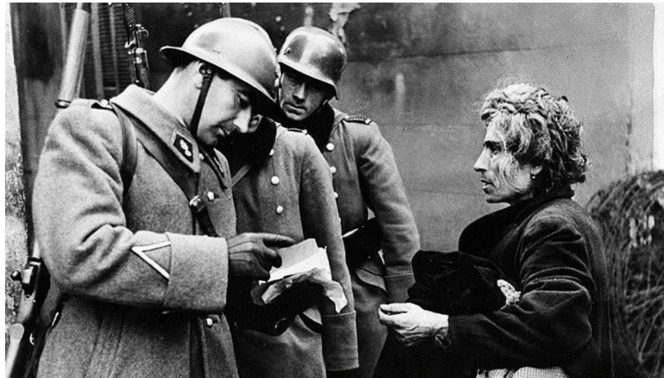
photographie de la rafle de Marseille en 1943

Au total, 6 584 juifs sont raflés sur 12 538 juifs arrêtés. En plus de ces milliers d'arrestations, 10 suicides et tentatives de suicides sont enregistrées.